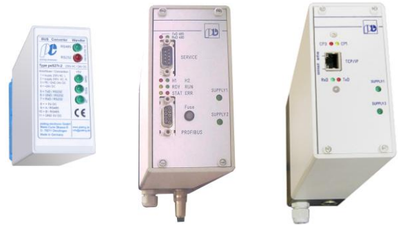
Optionale Interfaces / Schnittstellenwandler: RS232, PROFIBUS®, ETHERNET