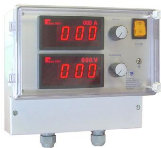
Bedieneinheit 200-D im Wandgehäuse mit großen Digitalanzeigen