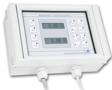
Programmierbare Bedieneinheit pe270-D im Wandgehäuse mit LCD-Anzeigen