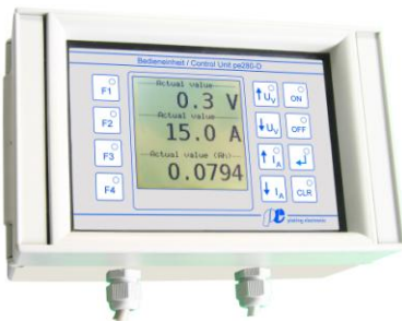
Programmierbare Bedieneinheit 280-D im Wandgehäuse mit LCD-Anzeigen

Größe und Position der Hochstromschienen können vom Standard abweichen.