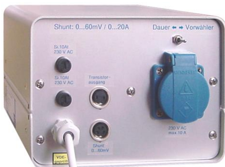
Dosierstation pe6020-G, Rückseite